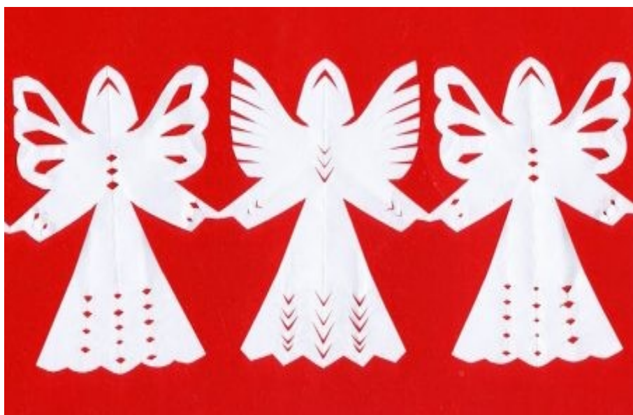
В этой работе объединили две техники: прорезную и ленточную

На общий фон наклеивают заранее подготовленные фрагменты: вырезки из журналов, пришедших в негодность детских книг.