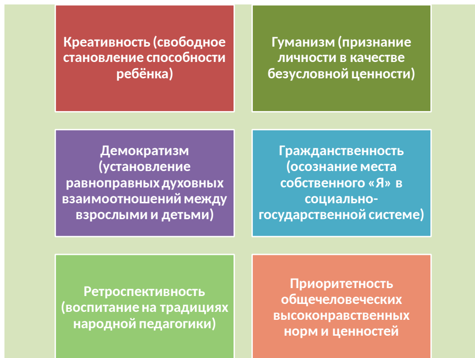
Рис. 3 – Принципы современного семейного воспитания

Простое сравнение позволяет выявить множество отличий в семейном воспитании прошлого и настоящего, в которых, возможно, и заключаются его результаты.