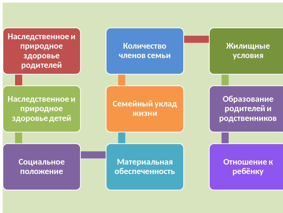
Рис. 1 – Факторы, влияющие на семейное воспитание

С.И. Ожегов рассматривает традиции как нематериальное достояние, которое можно накапливать и передавать из поколения в поколение. Это взгляды, идеи, образ мысли, вкусы, семейные ориентиры, духовность и др [8].