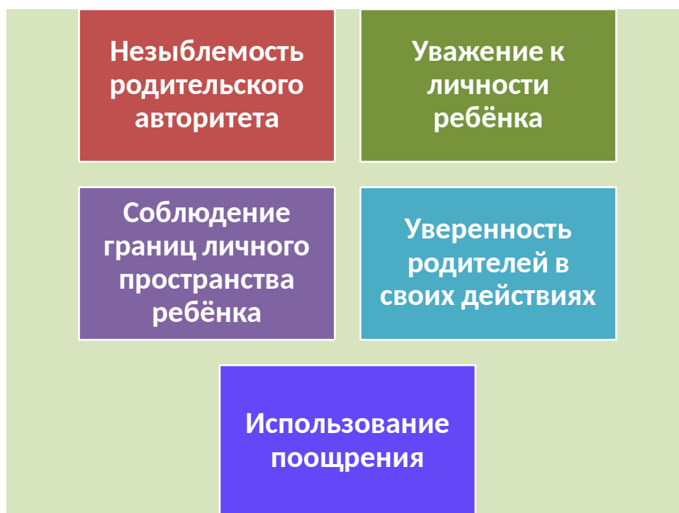
Рис. 4 – Правила семейного воспитания

Но какие бы не царствовали времена, простые правила семейного воспитания всегда приносят добрые плоды (см. рисунок 4)