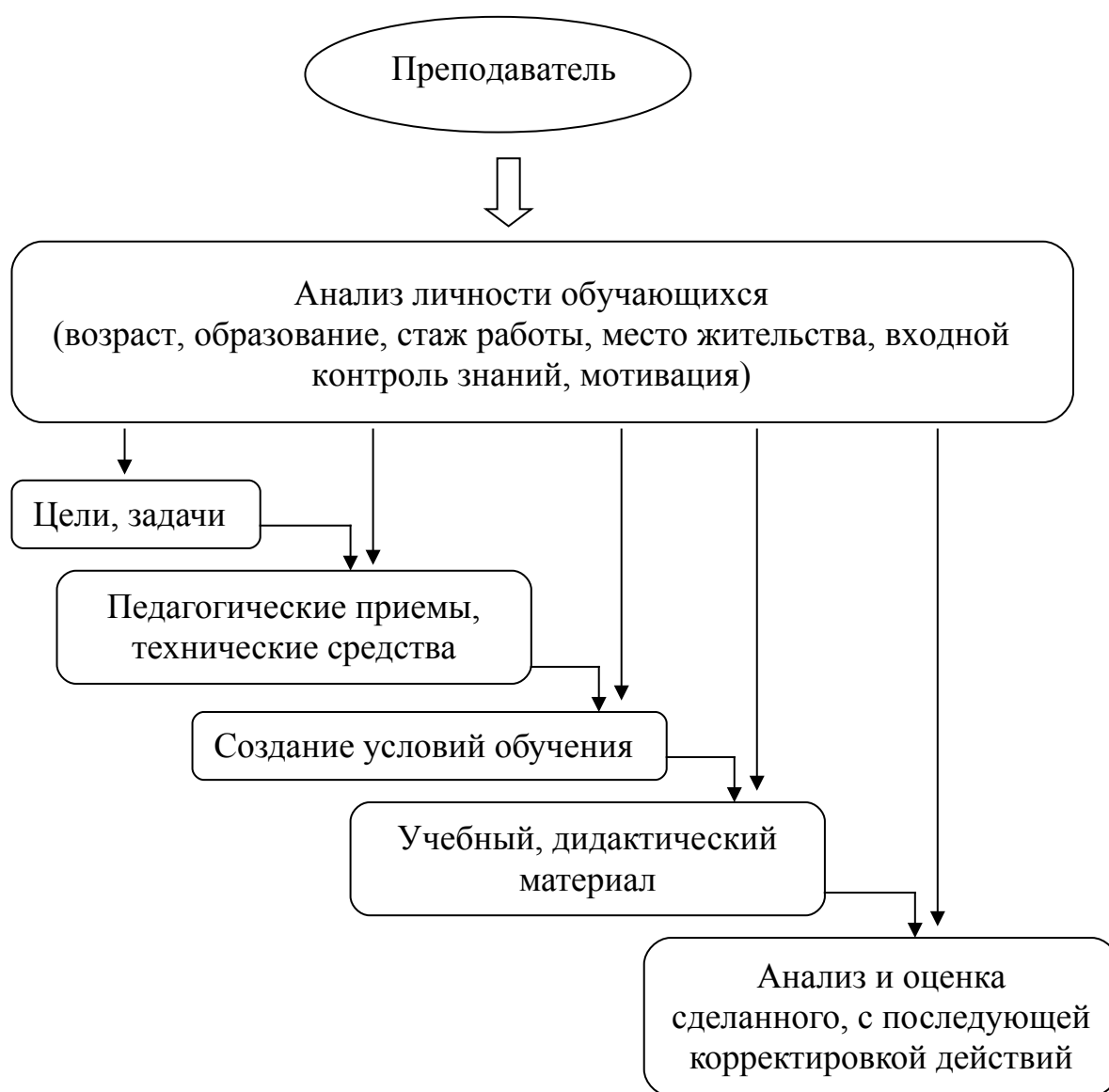
Рисунок 1. Схема действий преподавателя при создании эффективной коммуникации.

Прежде чем перейти к отражению алгоритма эффективной коммуникации необходимо отметить определяющую особенность при организации учебного процесса. При обучении взрослого контингента первоочередной задачей для преподавателя должно быть проведение анализа личности обучающихся (см. рис.1). На основании полученных результатов преподаватель должен определять конкретные учебные цели, подбирать соответствующий учебный материал, находить и применять способы и средства обучения, создавать микроклимат в группе, способствующий продуктивной работе и получению хороших знаний, а также достижению поставленных целей.