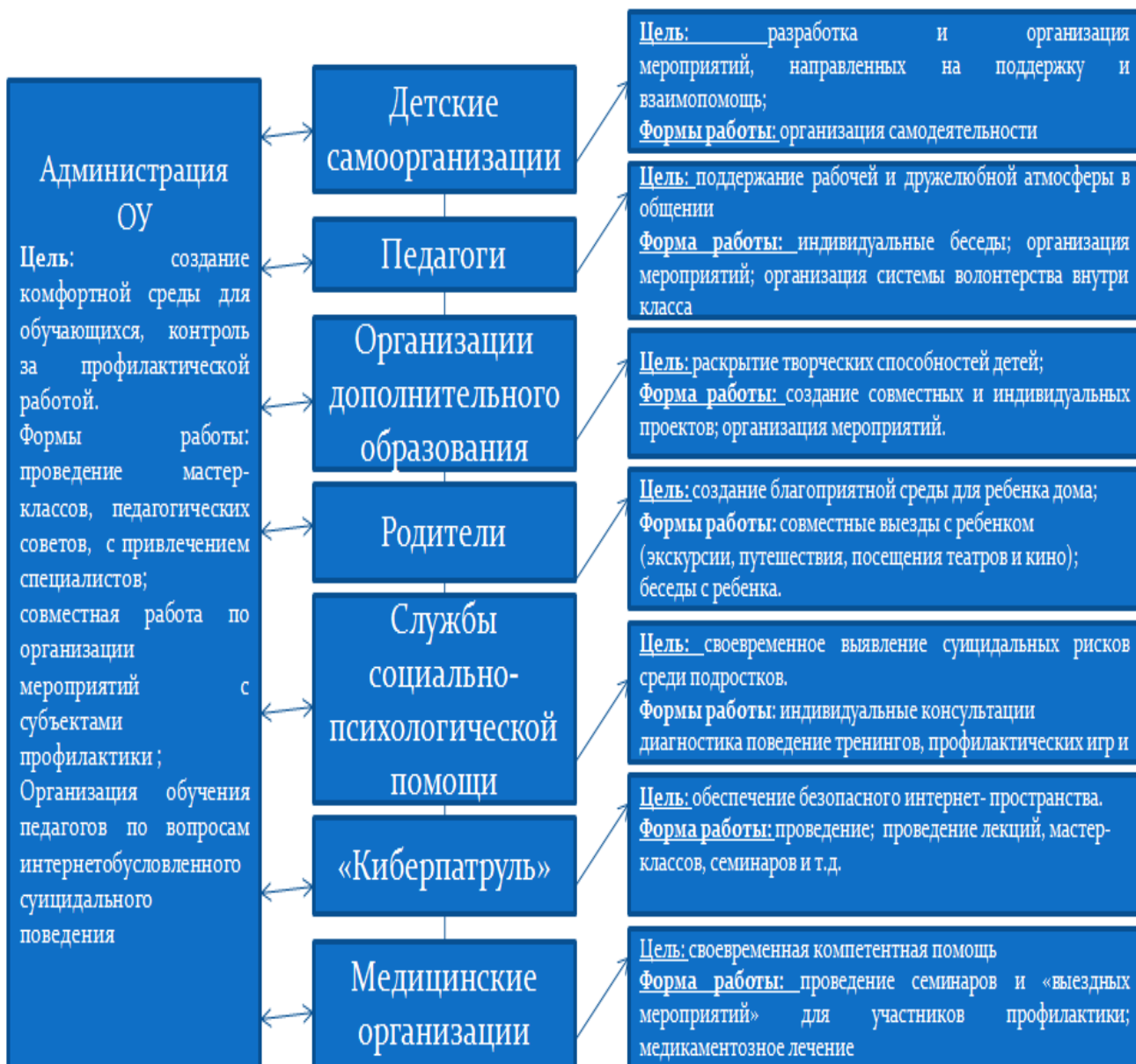
Рис. 1 Профилактическая модель интернетобусловленного суицидального поведения подростков в условиях образовательного учреждения