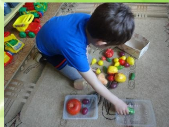
Разложи по группам