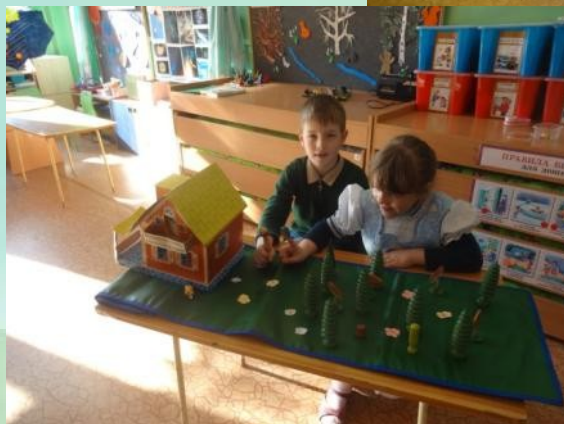
В какую игру я играю