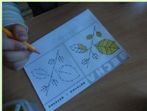
Дорисуй по точкам