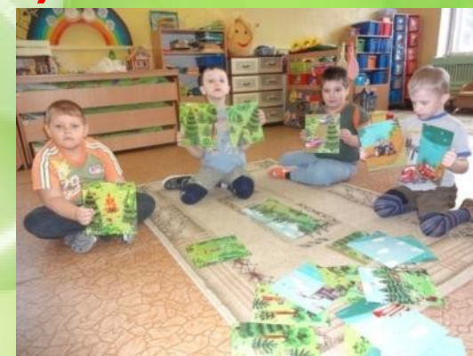
Стань другом природы