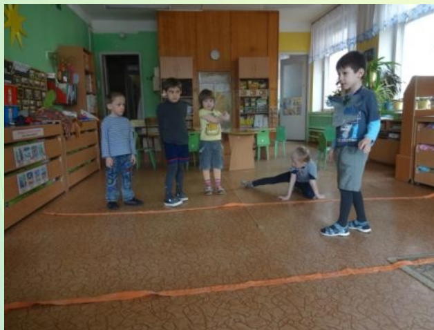
Волк во рву