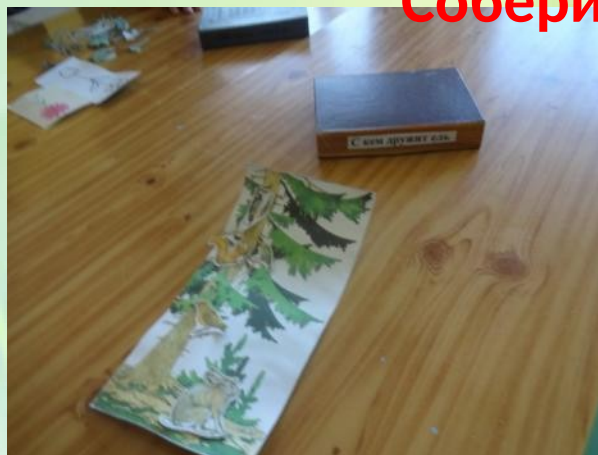
С кем дружит ель