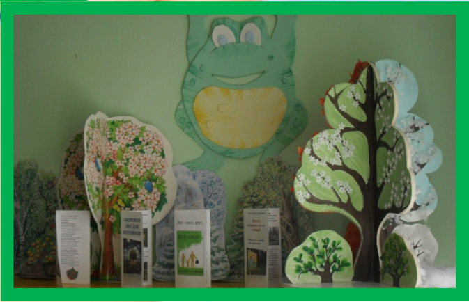
ВЫСТАВКА БУКЛЕТОВ и ЛИСТОВОК "СОХРАНИМ ЛЕС ПОТОМКАМ!"