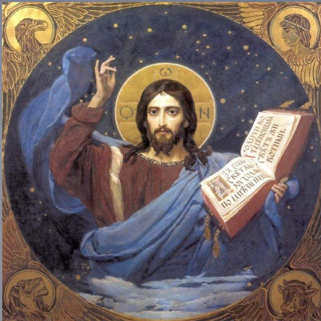
В Васнецов. Христос Вседержитель