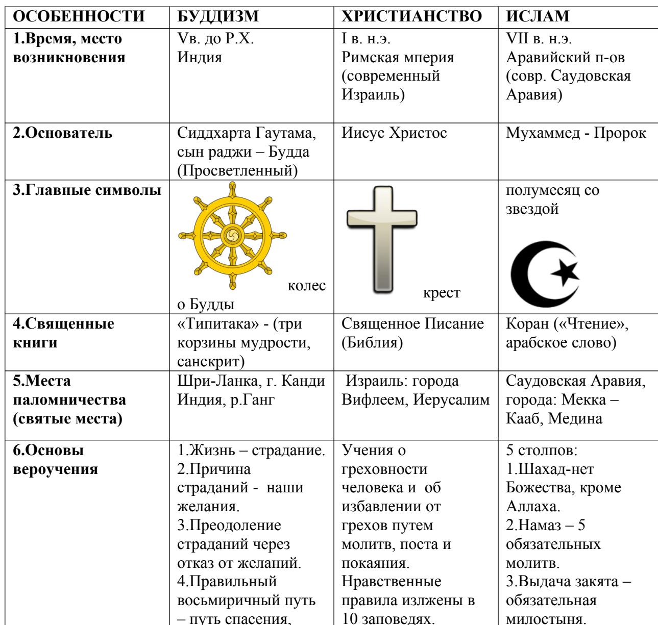
Таблица «Мировые религии» заполняется обучающимися на учебном занятии.

Сначала дается шаблон таблицы «Мировые религии», он проектируется на экране. Обучающиеся переносят в тетрадь ее «шапку». Первую колонку «Особенности» заполняют последовательно, в соответствии и в порядковом номером, в ходе изучения вопроса. Заслушиваются доклады-справки учащихся «Мировые религии», используя знания из курса истории